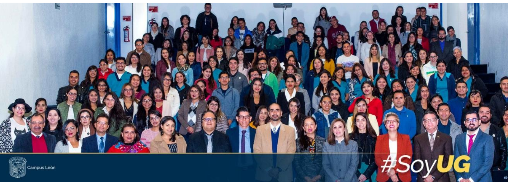
Ilustración 3. Foto oficial de la inauguración de la 3ª Cátedra de Nutrición.