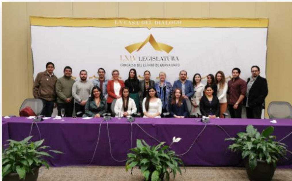
Ilustración 11. Comida “Conversando con el Experto” en el Congreso del Estado Guanajuato