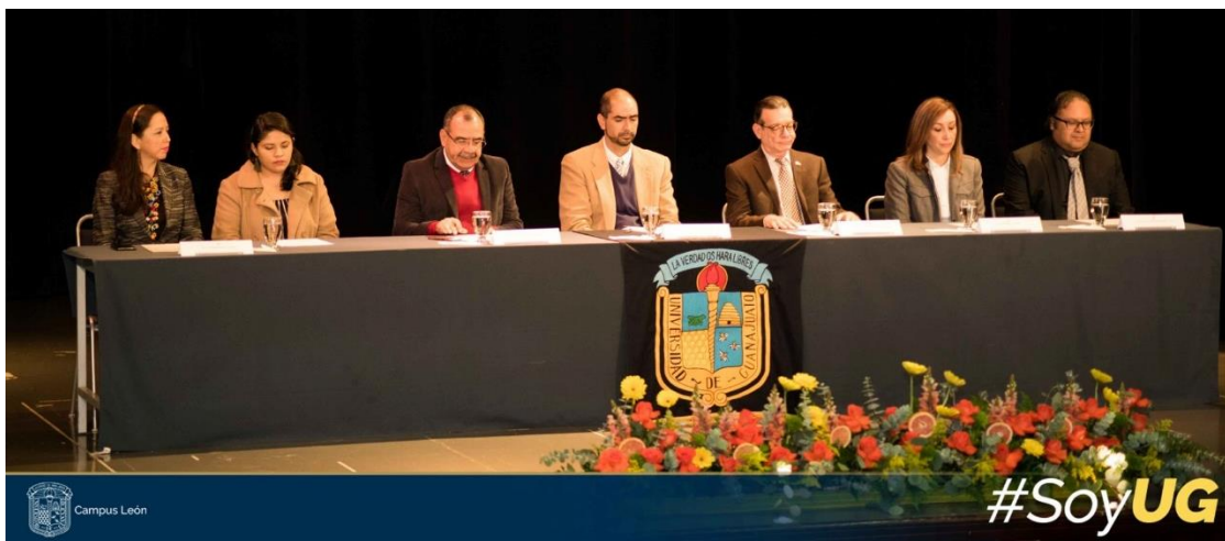
Ilustración 3. Presídium de la 3ª Cátedra de Nutrición.