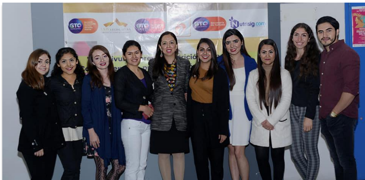
Ilustración 1. Equipo Organizador OUSANEG-UG