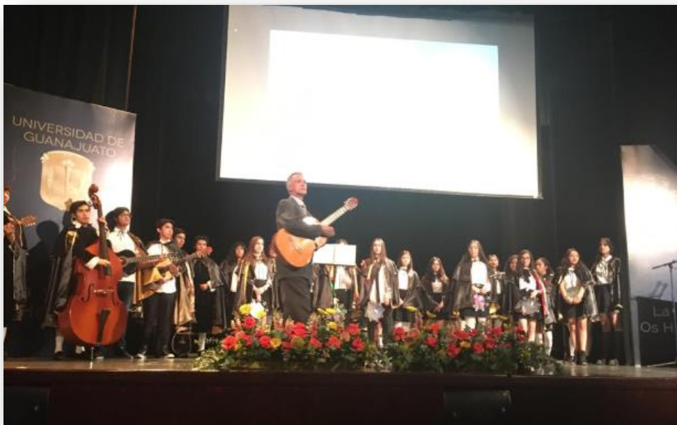
Ilustración 21. Evento cultural de la 3ª Cátedra de nutrición a cargo de la Estudiantina de la Escuela de Nivel Medio Superior, Centro Histórico León

“Más divulgadores en nutrición para el 2019: construyendo la primera acción para Guanajuato”