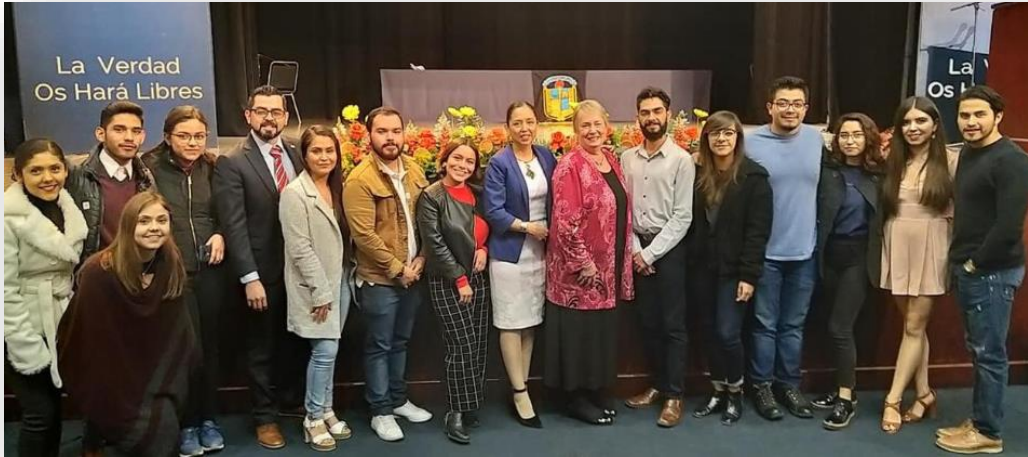
Ilustración 22. Clausura de 3ª CÁTEDRA DE NUTRICIÓN

“Más divulgadores en nutrición para el 2019: construyendo la primera acción para Guanajuato”