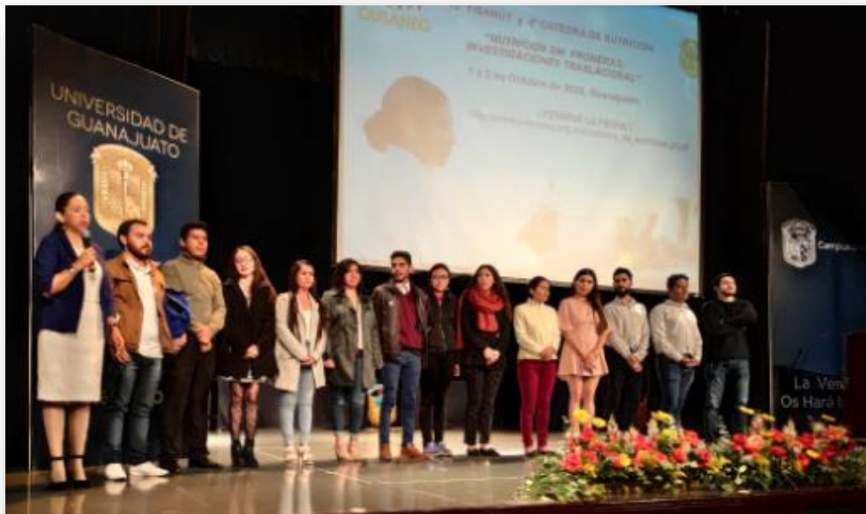
Ilustración 21. Clausura de la 3ª CÁTEDRA DE NUTRICIÓN