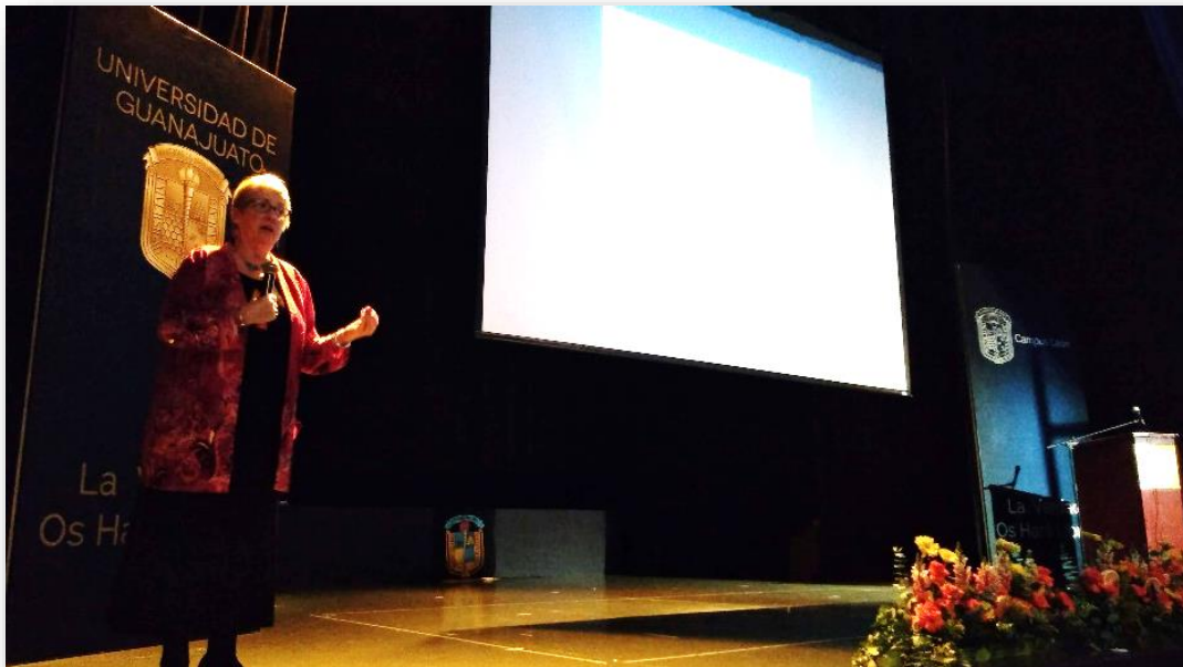
Ilustración 19. Dra. Sylvia Escott-Stump durante ponencia: “Public Health Nutrition: Innovation and Progress”