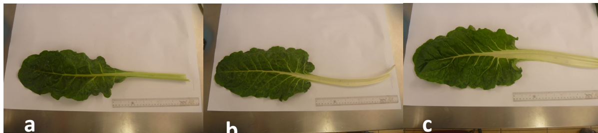
Imagen 1. a) Acelga testigo (T1), b) Acelga con A. brasilensis (T2), c) Acelga con microorganismos de montaña MM (T3)