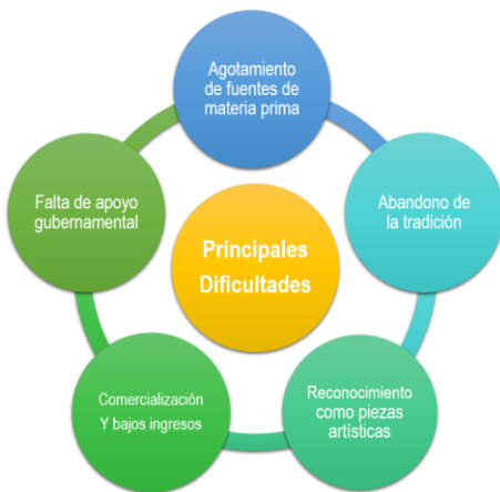
Imagen 6: Elaborado a partir de datos obtenidos en trabajo de campo.