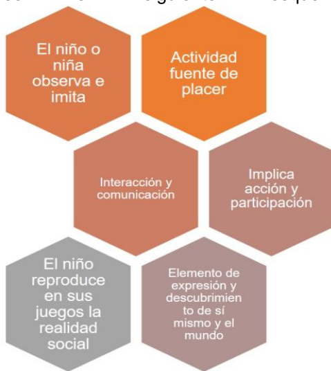
IMAGEN 2: Elaboración propia a partir de Garaigordobil (1992).

Las funciones psicomotrices básicas se sirven de forma espontánea para su desarrollo de las actividades lúdicas “de” y “con” movimiento del niño y la niña. El desarrollo psicomotriz no está dissociado del resto de las dimensiones del desarrollo de la niñez, pues, se entremezclan las mejoras psicomotrices con las socio-afectivas de forma directa y continua [7]. Al respecto puede observarse el siguiente esquema: